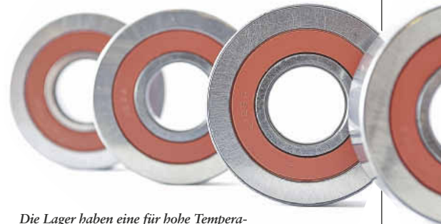
Die Lager haben eine für hohe Temperaturen ausgelegte Lebensdauerschmierung.

Kugellager | Der Swisstech-Aussteller Jesa SA mit Sitz in Villars-sur-Glâne/Schweiz bietet mehrere Abmessungen und Dichtigkeitstypen von Kugellagern an. Das Basismodell „LR 202 2BRS“ mit einem Durchmesser von 40 mm hat eine dynamische Belastungskapazität (CwT) von 51'800 N und ist in zwei zusätzlichen Abmessungen mit Außendurchmessern von 34 und 42 mm verfügbar. ●